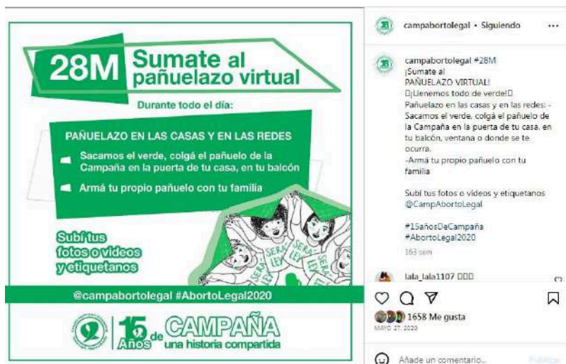
Campaña Aborto Legal [@campaborto]. (27 de mayo de 2020). #28M Convocatoria al pañuelazo virtual. Instagram.

Por otro lado, el 28 de mayo, el video inaugural de la jornada, “15 años de Campaña. Un Proyecto de vida. Una historia compartida”, con unas 75.000 reproducciones en Instagram, comenzó con una alocución de la icónica Dora Coledesky, fundadora en 1988 de La Comisión por el Derecho al Aborto, primer grupo feminista dedicado a batallar por la legalización del aborto en Argentina. Luego, a modo de collage genealógico, contiene un conjunto amplio y variado de declaraciones, videos, audios e imágenes de otras conmemoraciones del 28 de mayo, así como inserts de una festiva “corrida abortera” con bengalas, de pañuelazos y de la votación favorable de 2018 en la Cámara de Diputados.