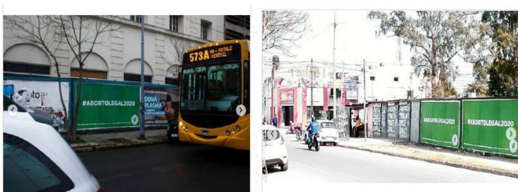
Campaña Aborto Legal [@campaborto]. (7 de agosto de 2020). Afiches callejeros en Mar del Plata y Santiago del Estero con el reclamo #AbortoLegal2020. Instagram

empapeladas con afiches callejeros de fondo verde con el hashtag #AbortoLegal2020 como slogan central y, al pie, la triple consigna “Educación sexual para decidir, anticonceptivos para no abortar, aborto legal para no morir”, ancla el sentido, en tipografía blanca. Una acción colectiva puntual para otorgar visibilidad pública al reclamo en las calles del país, por fuera del circuito de las redes sociales. Una primera apuesta disruptiva en carteleras públicas al lado de recomendaciones sanitarias preventivas y publicidades comerciales habituales, para recuperar el sentido político de ocupar la calle, sin la presencia física de activistas como otrora pero con una táctica visible desde su estética y forma de exposición.