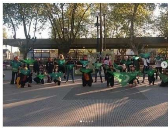
Campaña Aborto Legal [@campaborto]. (30 de setiembre de 2020). Acciones por el #28S de las regionales Tucumán, Córdoba, Mendoza y Sureste GBA. Instagram.

Luego, un pañuelazo virtual convocado con insistencia los días previos coronó la ocasión, como símbolo unificador que potenció el reclamo con el retorno de las calles a las casas. De los grupos pequeños, con medidas de cuidados, a una reunión colectiva sincronizada novedosa. A la hora pautada, se desplegó una interesante panorámica móvil. Una pantalla compartida de 25 cuadros de activistas