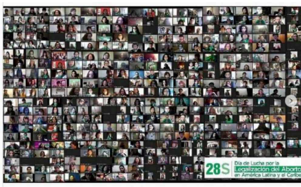
Campaña Aborto Legal [@campaborto]. (28 de setiembre de 2020). #28S Pañuelazo virtual. Instagram.

Mientras tanto, el “mové las redes” a lo largo de la jornada resultó interpelador, con un resultado destacable en Twitter, donde el hashtag #AbortoLegal2020 operó como un aglutinador eficaz que volvió a marcar tendencia, con un récord de permanencia en el listado superior a las 20 horas en conversación y el primer puesto en las tendencias locales. El resultado, extendido hasta el día siguiente por la intensidad de las interacciones, no sería resultado de un hecho aislado ni producto del mero azar algorítmico; más bien, se vincularía con un intenso activismo ciberfeminista desarrollado a lo largo de años. Incluso, se puede activar sin convocatoria expresa a tuitear en una franja horaria definida, como en este caso. Ante este desempeño visible en redes, por su parte, los sectores contrarios a la legalización del aborto respondieron con el contrahashtag #NoSeraLey, diseñado para ocluir el deseo en danza.