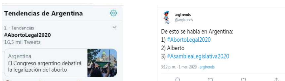
Tendencias en Twitter Argentina [@Twitter] y Arg trends [@argtrends]. (1° de marzo de 2020).

A este clima signado por el entusiasmo activista, días más tarde, se sumó el compromiso explícito del presidente de la Nación, Alberto Fernández, durante la apertura de las sesiones legislativas el 1° de marzo de 2020, de enviar un proyecto de ley al Congreso de la Nación para un nuevo debate sobre la interrupción voluntaria del embarazo. Por su parte, mediante #AbortoLegal2020, el ciberactivismo feminista convirtió el anuncio en primer trending topic en Twitter y con ello incrementó el circuito de las repercusiones mediáticas. El contramovimiento a la legalización del aborto respondió con el hashtag #Abortoesgrieta.